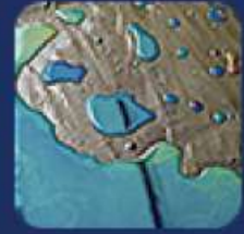
จุดเปียก