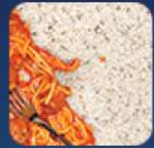
บนพื้นพรสม